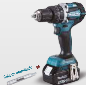
Guía de atornillado + B-52934