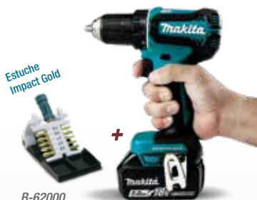
Estuche Impact Gold + B-62000