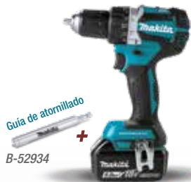
Guía de atornillado + B-52934