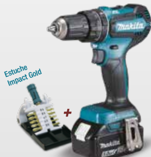
Estuche Impact Gold + B-62000